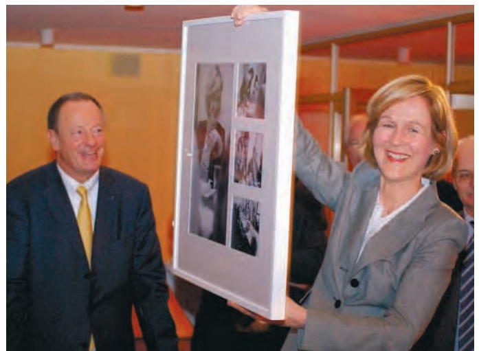
Das Abschiedsgeschenk des Kammervorstandes. Links: BRAK-Präsident Axel C. Filges.